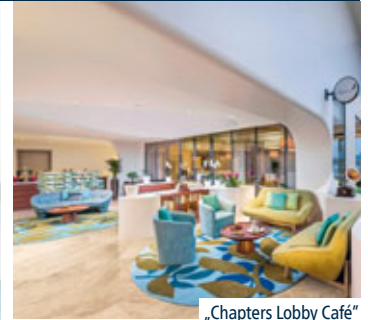
„Chapters Lobby Café“