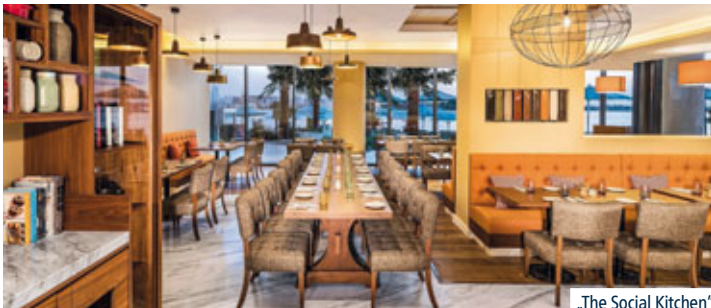
„The Social Kitchen“