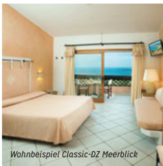
Wohnbeispiel Classic-DZ Meerblick