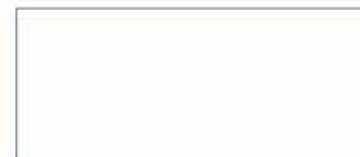
Familie am See