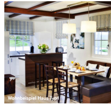
Wohnbeispiel Haus Typ1